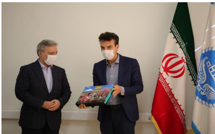
شکل ۲- بازدید سفیر ایتالیا از دانشگاه تهران