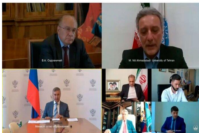
شکل ۱- برگزاری اجلاس روسای ۱۳ دانشگاه برتر ایران و روسیه- تابستان ۱۳۹۹