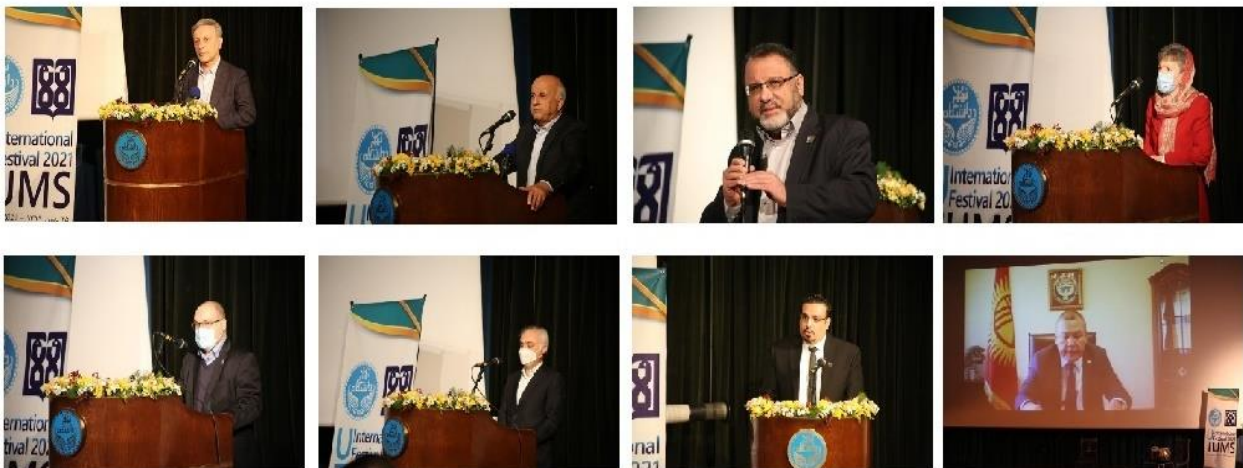
شکل ۴- برگزاری جشنواره بین الملل با همکاری دانشگاه علوم پزشکی تهران